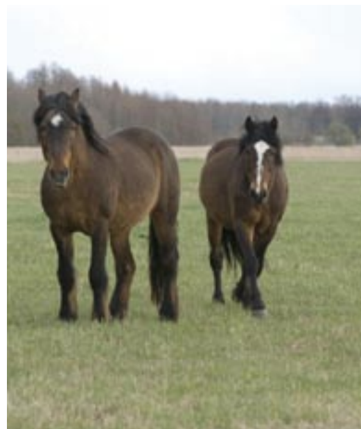
Hevonen on laumaeläin, jolla pitäisi olla ainakin yksi hevoscaveri.

Kun hevoset viimein pistettiin yhteen, seisoiimme jännittyneinä laitumen reunalla. Odotimme, että jonkinlainen voimien mittelo on väistämättä edessä. Edellisessä kodissaan Piku oli joutunut oriin kiusaamaksi, joten kun Hoolek tuli sen mielestä liian lähelle, se huitaisi takajaloillaan ja päästi falsettiin kiirivän kiljahduksen.